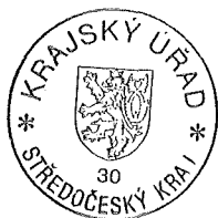
Bc. Marek Vondra odborný referent

Proti rozhodnutí odvolacího správního orgánu se podle § 91 odst. 1 správního řádu nelze dále odvolat.